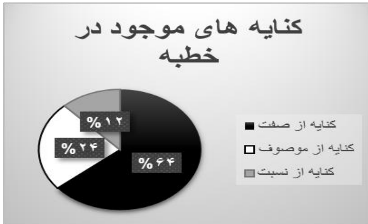
نمودار ۱: درصد انواع کنایه در خطبه قاصعه

از ۲۵ جمله کنایه‌ای در خطبه قاصعه، ۶۴٪ درصد کنایه از صفت، ۲۴٪ کنایه از موصوف و ۱۲٪ را کنایه از نسبت به خود اختصاص داده است.